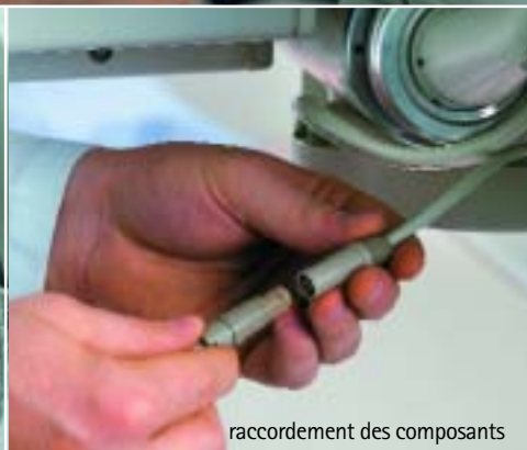
raccordement des composants