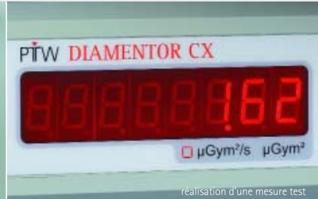
réalisation d'une mesure test