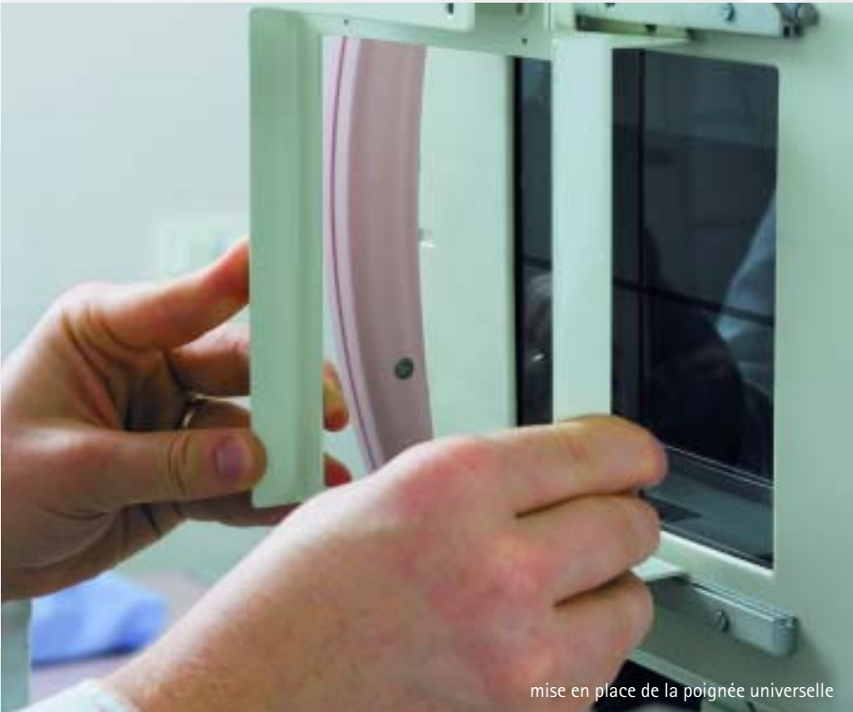
mise en place de la poignée universelle