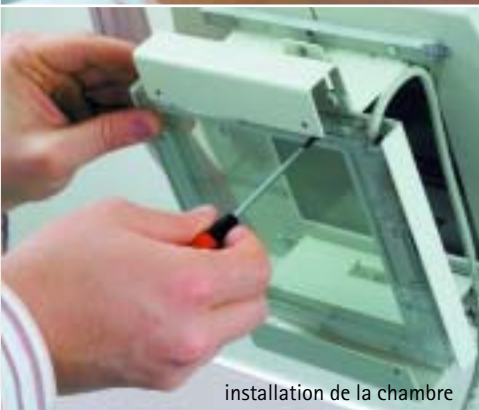
installation de la chambre